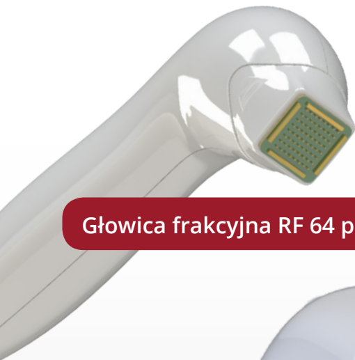
Głowica frakcyjna RF 64 piny