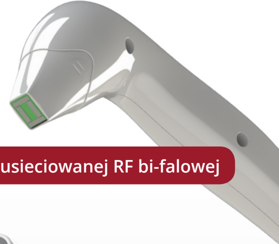
Głowica usieciowanej RF bi-falowej