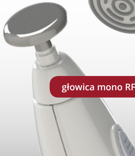
głowica mono RF