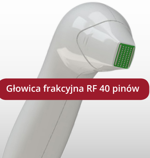
Głowica frakcyjna RF 40 pinów